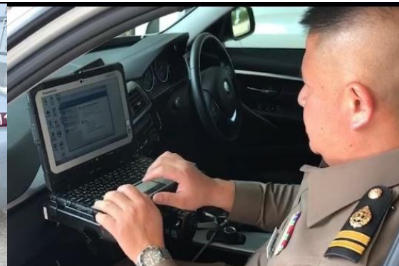
รถยนต์ไฟฟ้าตรวจการณ์อัจฉริยะ (SMART PATROL CAR : SPC)