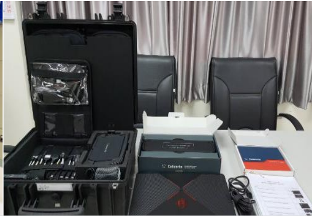
ชุดตรวจพิสูจน์หลักฐานโทรศัพท์มือถือ (Cellebrite)