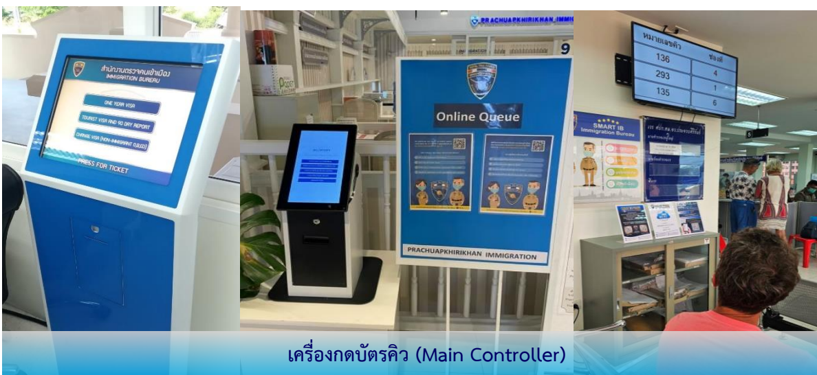
เครื่องกบฏคิว (Main Controller)