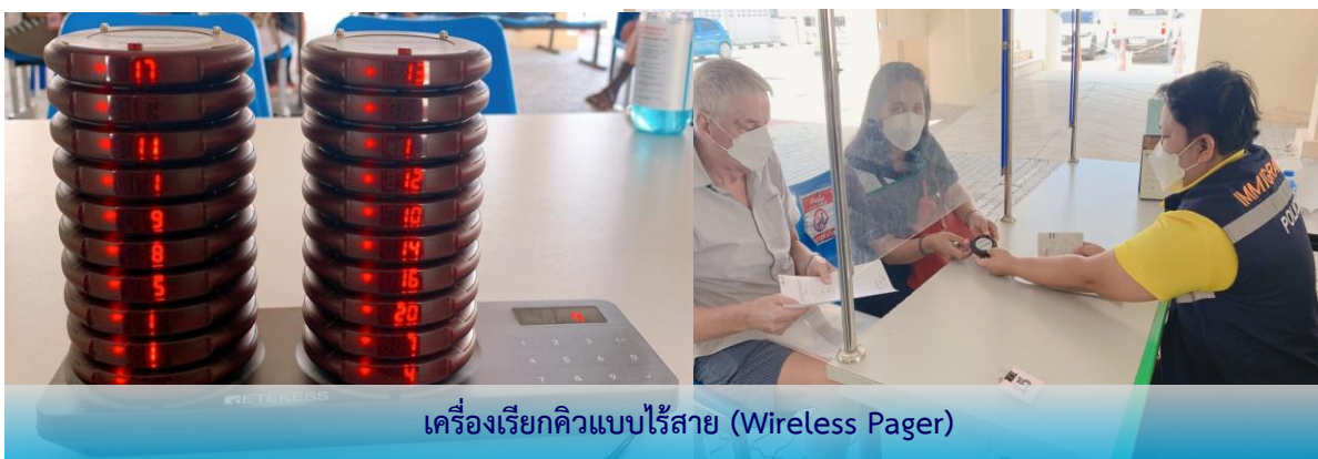
เครื่องเรียกคิวแบบไร้สาย (Wireless Pager)