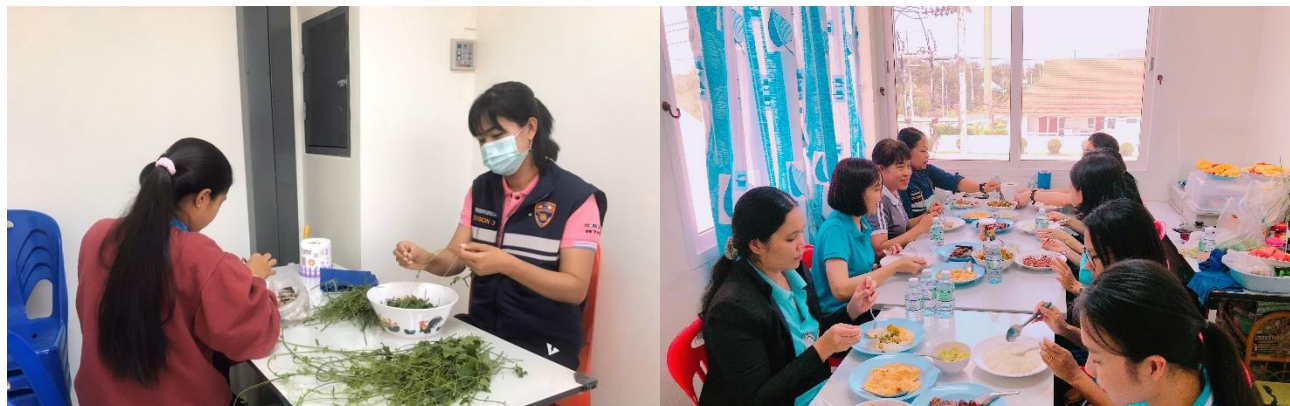
สวัสดิการอาหารกลางวัน