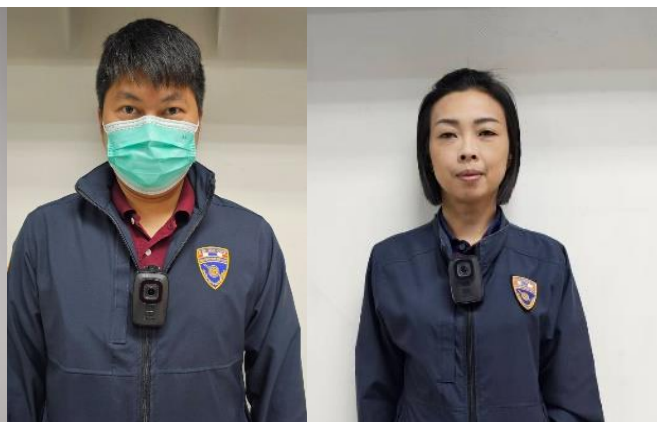
กล้องติดตัวเจ้าหน้าที่ตำรวจ (police body-worn camera : BWC)